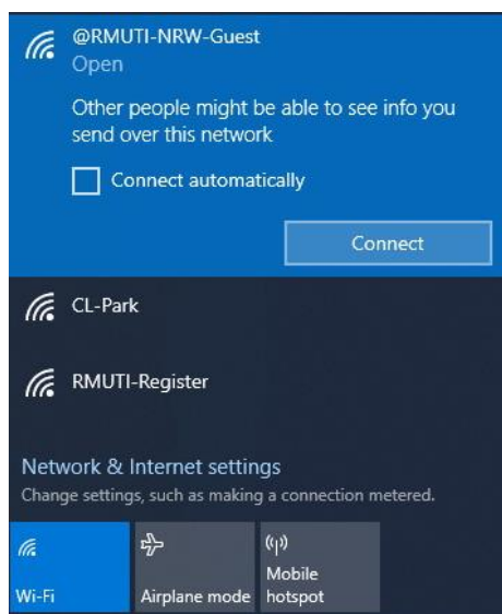
ภาพที่ 2 แสดงการเลือกเมนู connect เพื่อเชื่อมต่อ