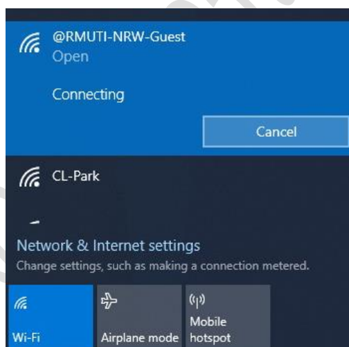
ภาพที่ 3 แสดงการเชื่อมต่อสำเร็จ