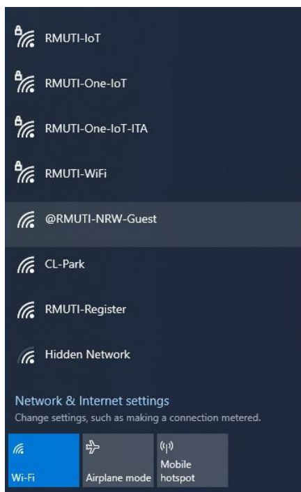
ภาพที่ 1 แสดงการเลือกเชื่อมต่อ SSID ชื่อ @RMUTi-Guest หรือ @RMUTi-NRW-Guest